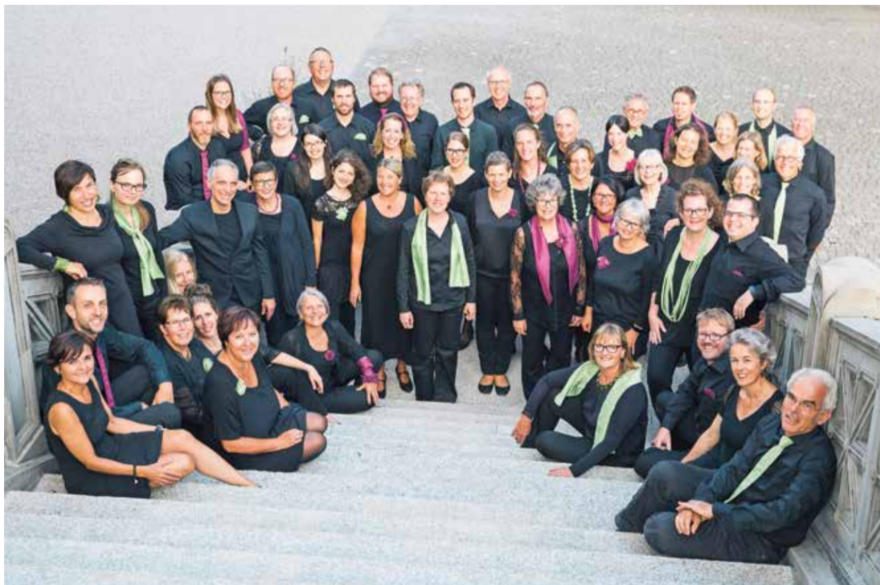
Der Chor Alpha-Cappella tritt zum ersten Mal im Weinland auf.

Dienstag, 28. November, 19 Uhr Saal tiefrot, Stadtbibliothek, Winterthur